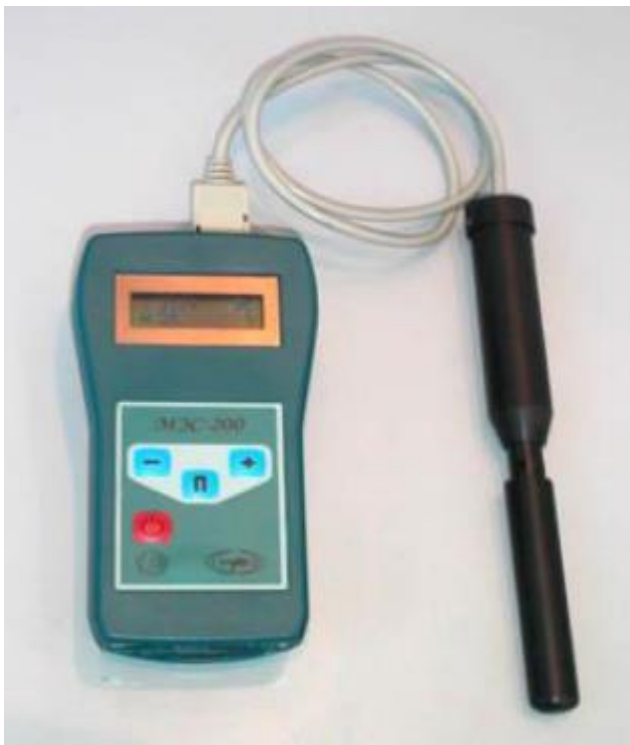
Рис.3 Метеометр МЭC-200