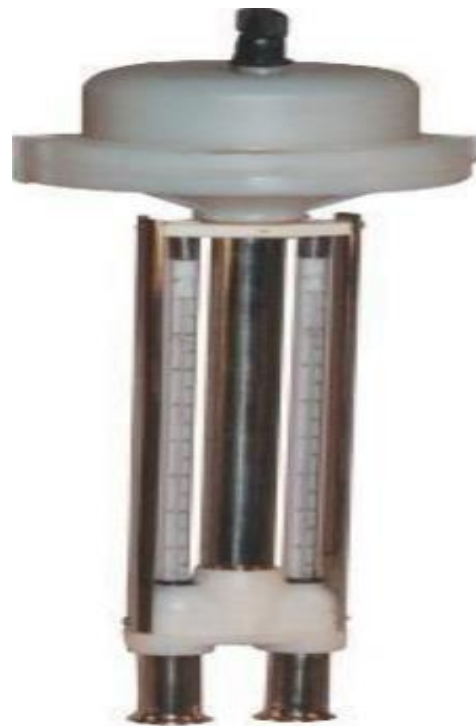
Рис. 4 Аспирационный психрометр