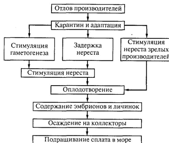
Рис. 1. Схема культивирования моллюсков

Содержание производителей. Производителей в преднерестовый период подготавливают следующим образом: 3...5-летних гребешков, добытых со дна или взятых с подвесных садков в количестве не менее 12 (6 самок и 6 самцов) по возможности быстро и с минимальными манипуляциями при плотности 1 особь на 2...3л воды и температуре, близкой к таковой в месте отбора, перевозят в лабораторию, где для карантина и адаптации помещают в проточные сосуды при той же температуре на 3...8 дней. Карантин завершается отбраковкой погибших, неактивных моллюсков и тех особей, у которых половые продукты не отвечают критериям зрелости. Минимально необходимое число производителей для создания личиночной культуры – не менее 3 каждого пола: разнообразие индивидуальных генотипов благоприятно сказывается на жизнеспособности потомства.